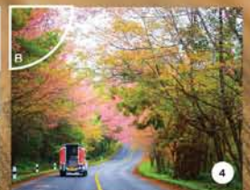
● ภาพที่ 4 จับคู่กับ...B....