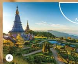
● ภาพที่ 3 จับคู่กับ...A....