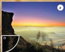
● ภาพที่ 2 จับคู่กับ...D....