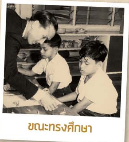
ขณะทรงศึกษา