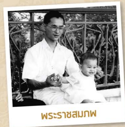
พระราชสมภพ

สมเด็จพระเจ้าอยู่หัวมหาวชิราลงกรณ บดินทรเทพยวรางกูร มีพระนามเมื่อแรกประสูติว่า "สมเด็จพระเจ้าลูกยาเธอ เจ้าฟ้าวชิราลงกรณ บรมจักรยาดิศรสันตติวงศ เทเวศรธำรงสุบริบาล อภิคุณูปการมหิตลาดุลเดช ภูมิพลนเรศวรางกูร กิตติสิริสมบูรณสวางควัฒน์ บรมขัตติยราชกุมาร" เป็นพระราชโอรสพระองค์เดียวในพระบาทสมเด็จพระปรมินทรมหาภูมิพลอดุลยเดช (รัชกาลที่ 9) และสมเด็จพระนางเจ้าสิริกิติ์ พระบรมราชินีนาถ เสด็จพระราชสมภพ ณ พระที่นั่งอัมพรสถาน พระราชวังดุสิต เมื่อวันที่ 28 กรกฎาคม พ.ศ. 2495 เวลา 17:45 น.