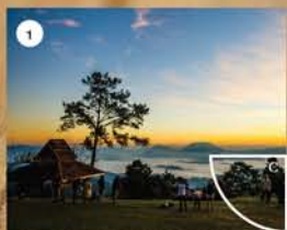
● ภาพที่ 1 จับคู่กับ...C....