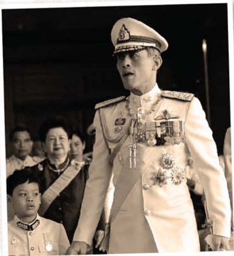
พระราชกรณียกิจ